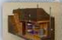
престроенные укрытия (или отдельные их части), приспособленные под гаражи, подполья и т.п.)