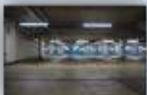
гаражи, складские и другие помещения, расположенные в отдельно стоящих и индивидуальных этажах зданий и сооружениях, в т.ч. в торговых и развлекательных центрах